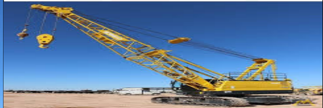
Counter Weight Condition